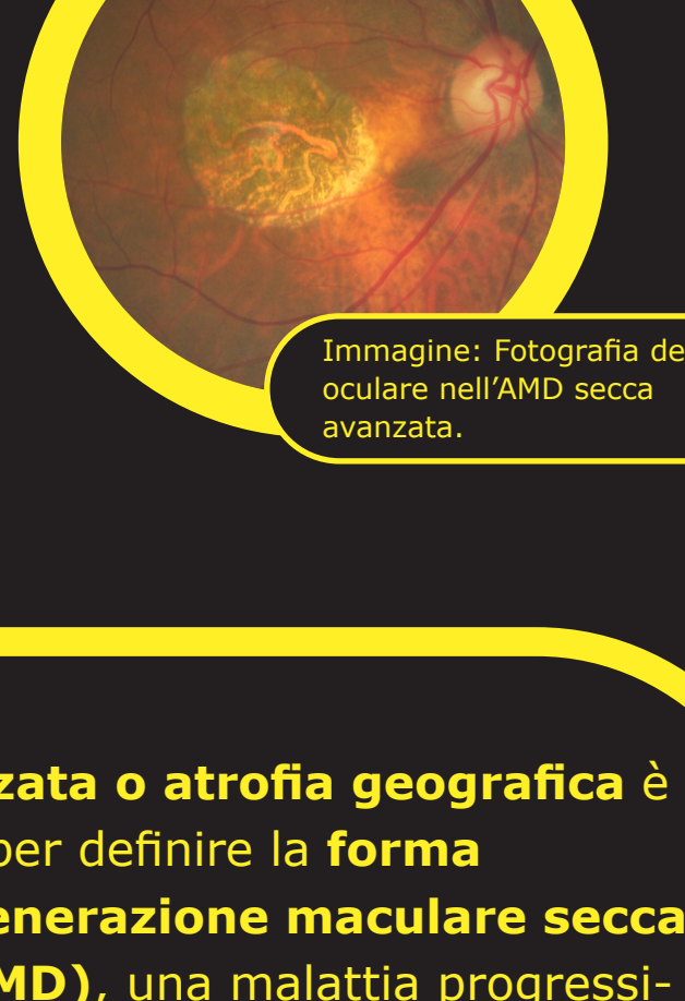
Immagine: Fotografia del fondo oculare nell'AMD secca avanzata.